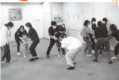
親子でミニ運動会