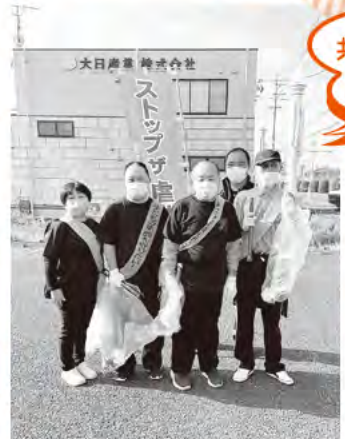
オレンジリボンウォーク