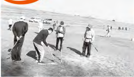
クラウンドゴルフ大会