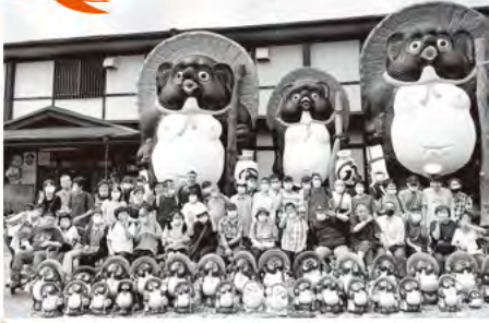
日帰り旅行 (信楽陶苑ためき村)